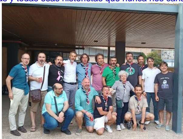
Lobatos y Viejos Lobos de los años 70 y 80 en la fiesta del 50 Aniversario

Con motivo del 50 Aniversario hacemos polos conmemorativos, celebramos una gran fiesta en los locales de la parroquia, con, juegos, comida, música y una con exposición de fotos. Acuden antiguos miembros del Grupo y todos rememoramos grandes momentos, aventuras y todas esas historietas que nunca nos cansamos de recordar.